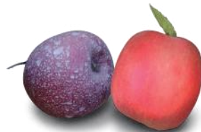
Tradizionale vs Equi-Sun

Aumenta la resa dei raccolti e riduce i costi di produzione.