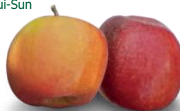
Differenza di colore dovuta a un colpo di sole