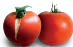
Differenza tra frutta con e senza cracking